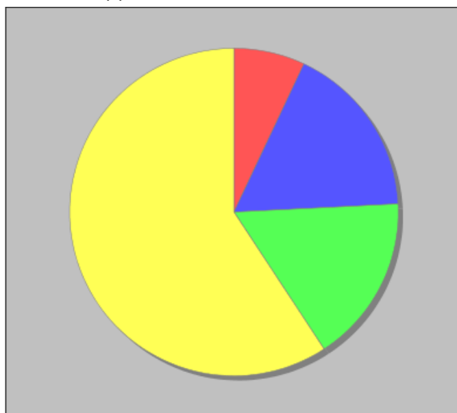
Distribuzione dei docenti a T.I. per anzianità nel ruolo di appartenenza (riferita all'ultimo ruolo)