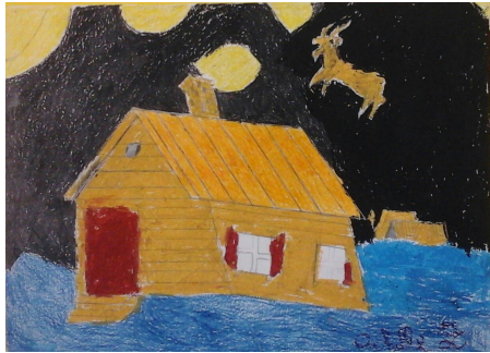
2) OYFN PRIPETSHIK (Mark Warshawky)