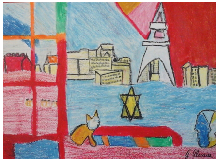
4) MAY WAY (Frank Sinatra)